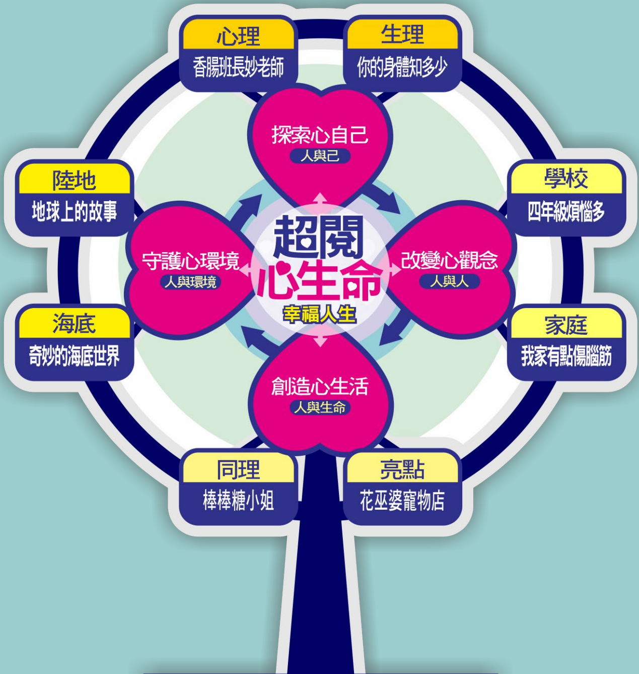
高雄市莊敬國民小學四年級校訂課程概念架構圖